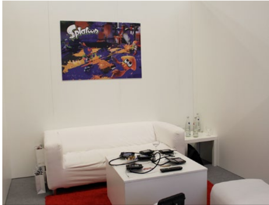
Nintendo bietet eine Stunde, eine Couch, eine WiiU (nicht im Bild) und sechs 3DSXL

Ich rate dir, dass du dich im Reisebus vernetzt, beispielsweise in einer WhatsApp Gruppe. Deine Kommilitonen haben eventuell Termine ergattert, bei denen mehr Menschen mitkönnen. Beispielsweise wurde zur Gamescom 2014 dem gesamten Bus ein Gespräch mit einem RIOT Mitarbeiter für League of Legends angeboten. Andere Kommilitonen hatten noch Wildcards zu vergeben. Ich persönlich hätte noch einige Menschen mitnehmen können zu verschiedenen Presseterminen. Als Beispiel sei hier Nintendo genannt: Ich hatte eine Stunde Zeit um die gesamte Produktpalette auszuprobieren. Es wäre jedoch viel spaßiger gewesen das neue Super Smash Bros. zu viert zu spielen.