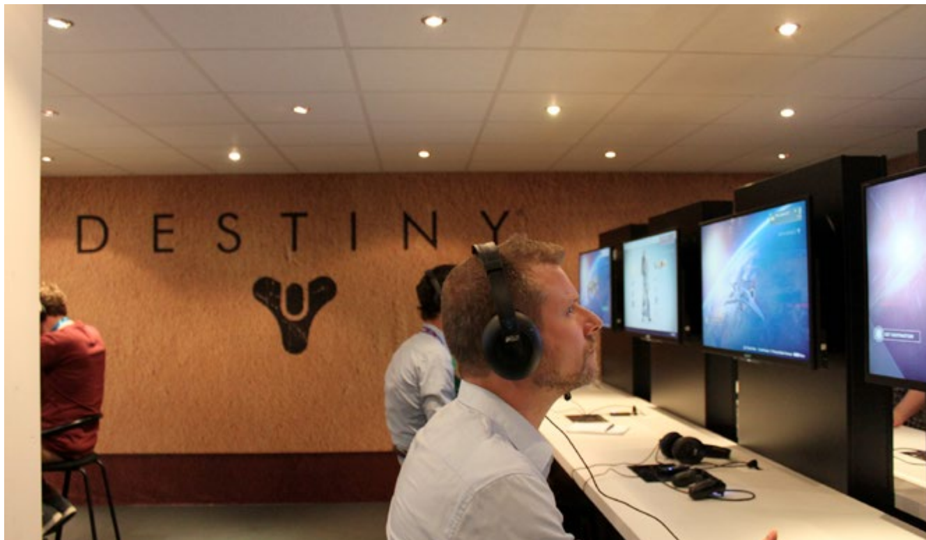
Der Hektik der Entertainment Area kann man bei Destiny in der Business Area entfliehen