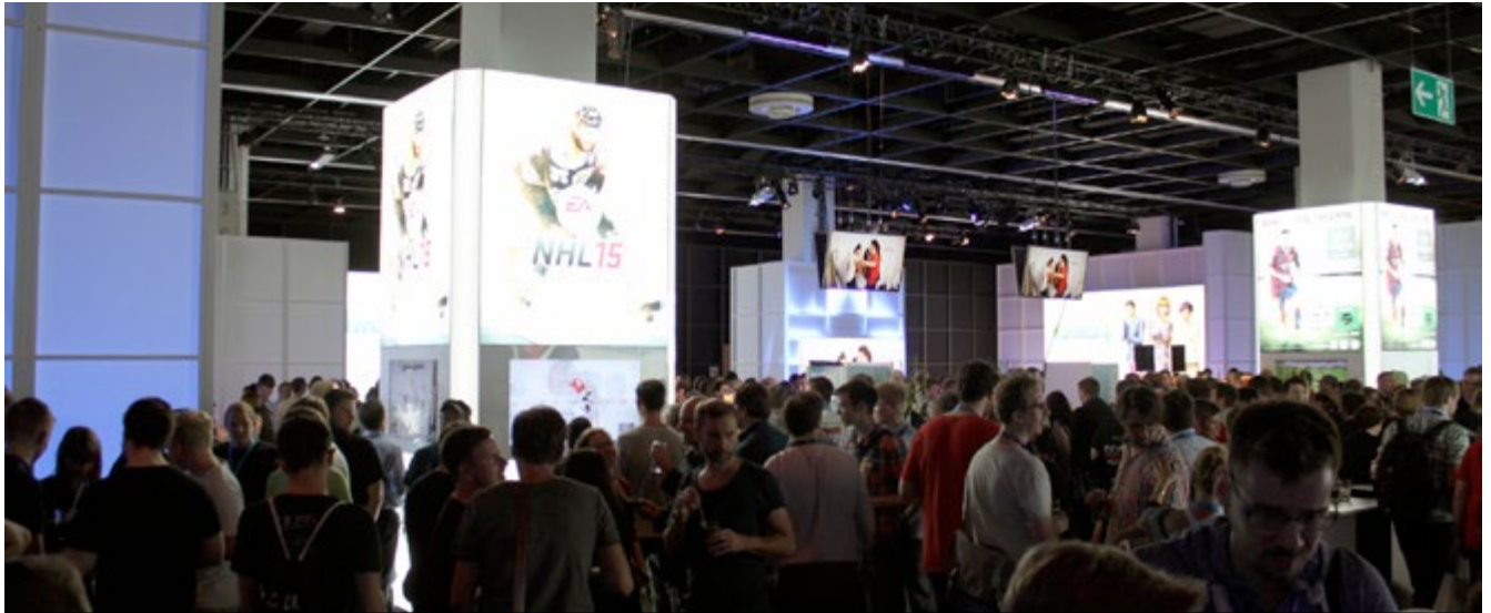
Die Afterparty am Mittwochabend sollte man nicht verpassen

Sehenswürdigkeit Deutschlands. Du kannst einen der Türme besteigen, meine Füße hatten dies jedoch nicht mehr mitgemacht.