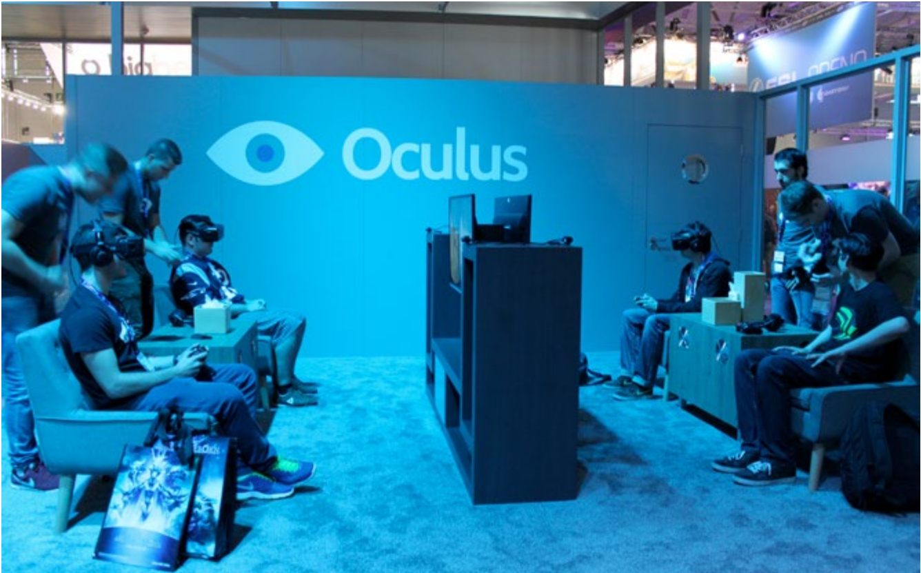
Lange Wartezeiten sind kein Wunder bei nur 20 Plätzen (vier je Spiel)

Bei Blizzard Entertainment war ich dabei, als Team-T-Shirts verteilt wurden und ich hatte die Gelegenheit für ein Gespräch mit diversen Entwicklern. Viele Stände erledigen noch letzte Vorbereitungen - So kann man beobachten, wie ein exklusives Konsolenspiel auf Windows gestartet wird oder Passwortlisten für Administrator-Accounts herumliegen.