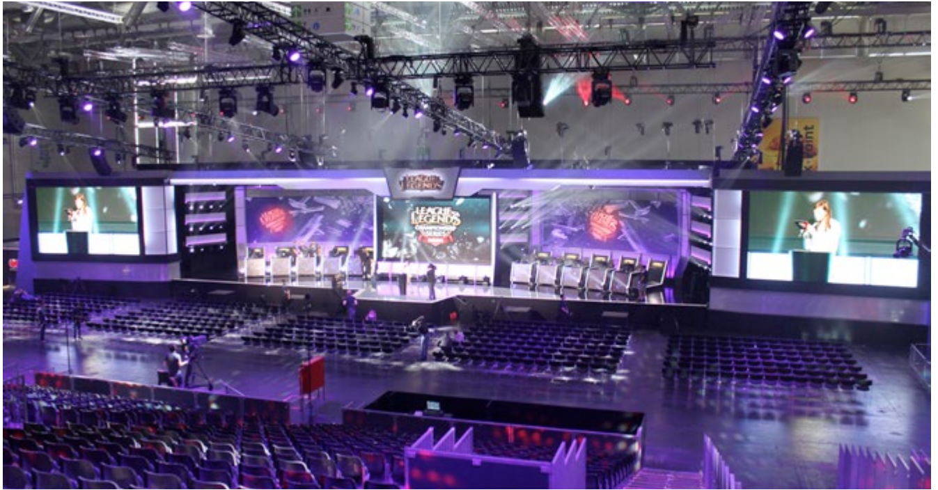
Letzte Proben vor dem Ansturm