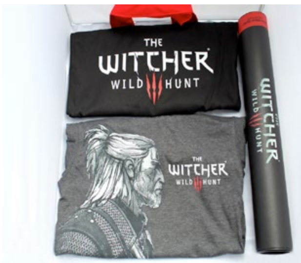
Tasche, T-Shirt und ein exklusives Gamescom-Poster: CD Project RED weiß, wie man Goodies macht

Auch die schönste Zeit geht mal vorbei. Vergleiche im Reisebus zurück nach München deine Erfahrungen mit den deiner Kommilitonen. Mit diesem Wissen hast du im nächsten Jahr sicherlich ein noch besseres Erlebnis. Wenn du wieder zu Hause bist und beim Rucksackleeren deine Mitbringsel begutachtest, dann fühlt sich das an wie ein zweites Weihnachten. Beta-codes, Plüschtiere, T-Shirts, und sogar ganze Computer kann man auf der Gamescom mitnehmen und gewinnen. Als Beispiel sei The Witcher 3: Wild Hunt