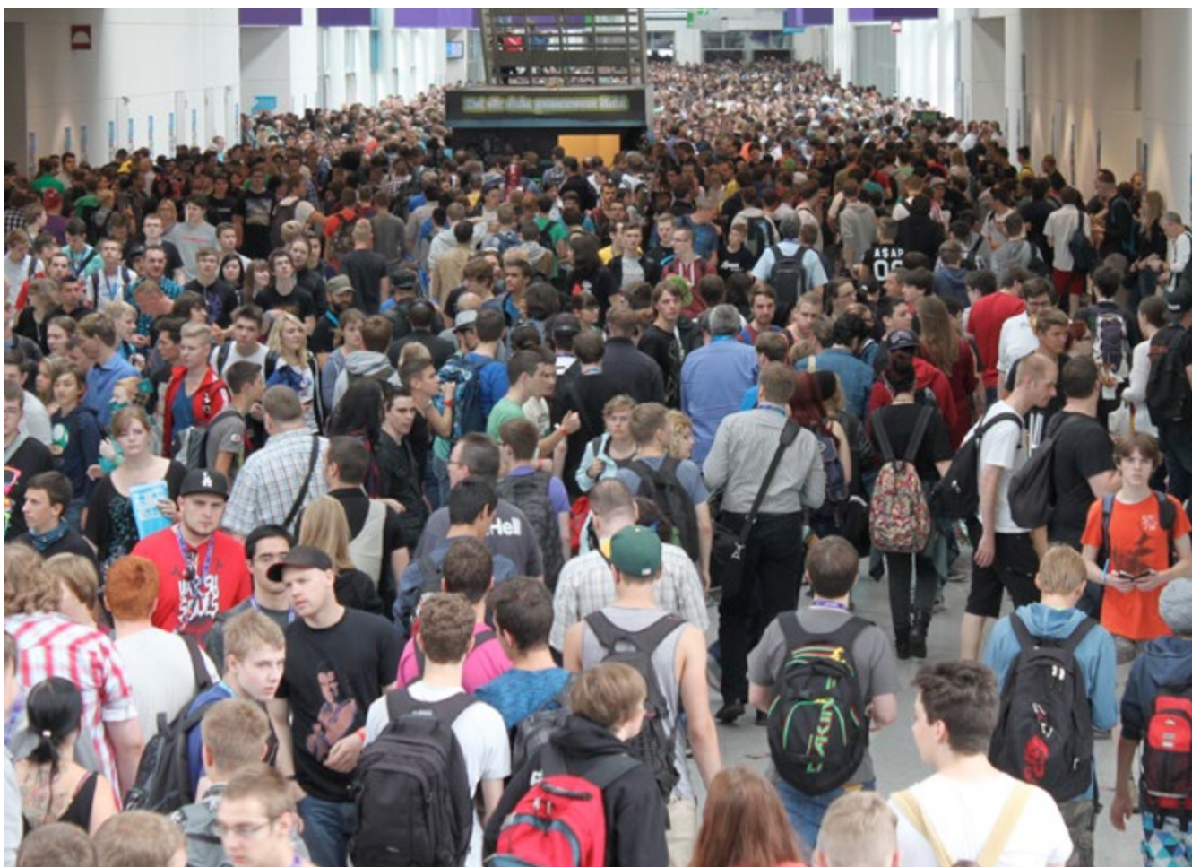
Donnerstags lohnt sich die Event Area wirklich nicht

Aber auch Kurzentschlossene müssen keine Wucherpreise zahlen: Über die private Zimmervermittlung (z.B. Airbnb) hatte ich noch 2 Wochen im Voraus ein Zimmer gebucht – für 35 Euro! Mit Kumpels zu campen geht natürlich immer.